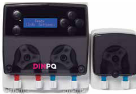
SISTEMA DE 3 BOMBAS PERISTÁLTICAS