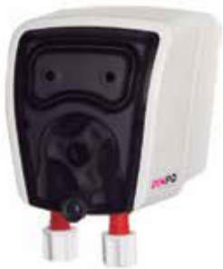
BOMBA PERISTÁLTICA UN PRODUCTO