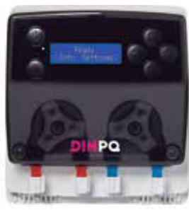
BOMBA DOBLE DE LAVAVAJILLAS Y ABRILLANTADOR

Racrisa ofrece un servicio completo con el Sistema KITCHEN SYSTEM LINE, el cual incluye unos MODELOS DE DOSIFICADORES que son la solución perfecta para satisfacer las necesidades de la restauración moderna, ofreciendo calidad y precio. Una gama que cumple los siguientes parámetros: